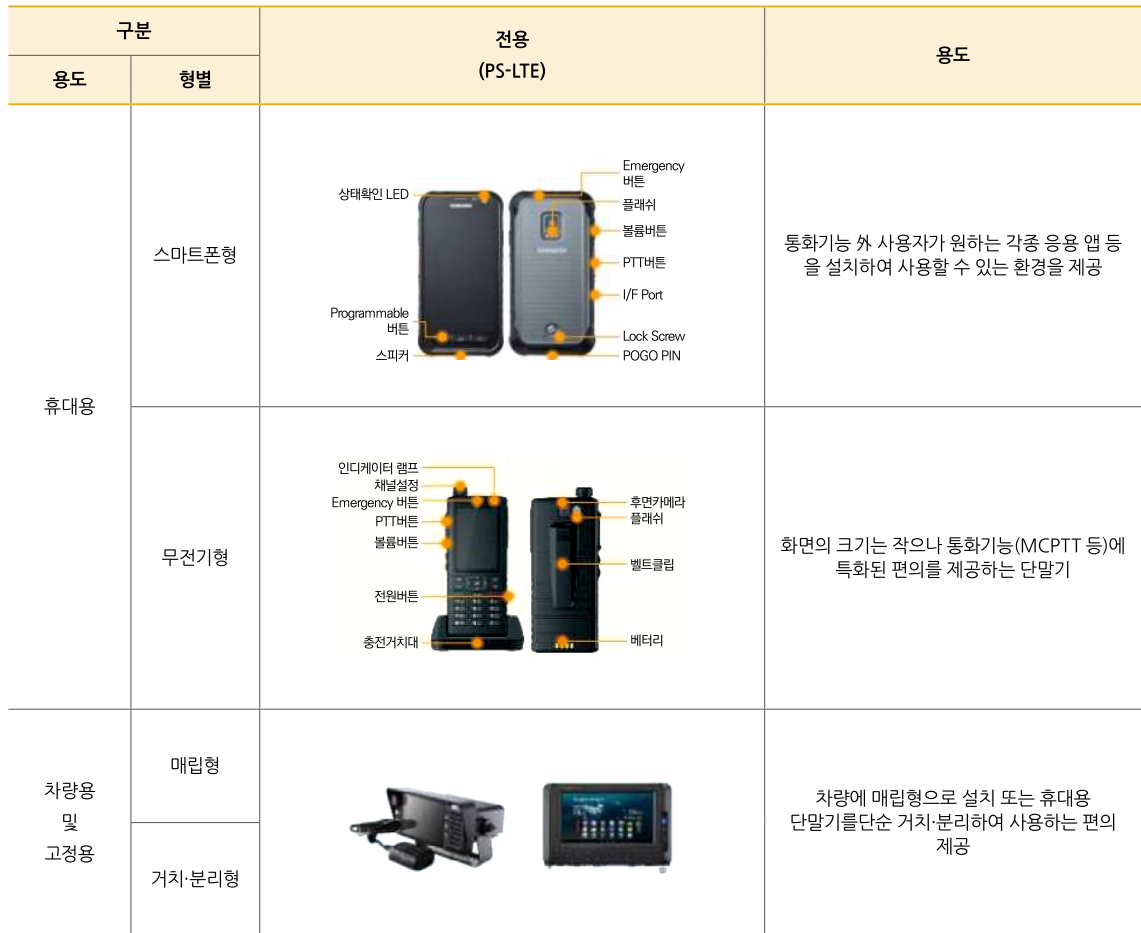
[그림 1] PS-LTE 단말기 타입[2]

MMS, CBS, MCPTT)요구 규격을 포함하고, 3GPP Rel. 12 및 13 기반의 규격을 인용·참조하였다.