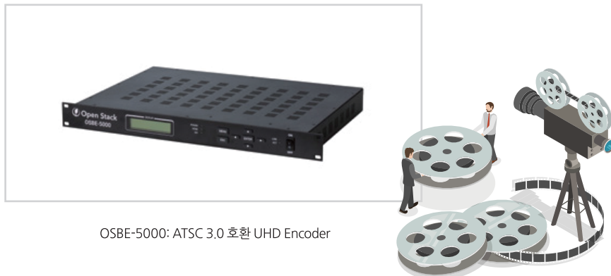
OSBE-5000: ATSC 3.0 호환 UHD Encoder