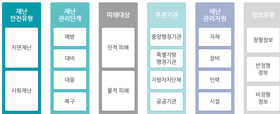
[그림 2] 재난안전정보 패킷 분류체계

‘재난 관리 단계’ 패킷은 재난안전정보가 지원하는 재난 관리의 단계 및 관련 업무를 분류·기술하기 위한 목적으로 설계되었으며, <표 2>와 같이 대분류 4개, 중