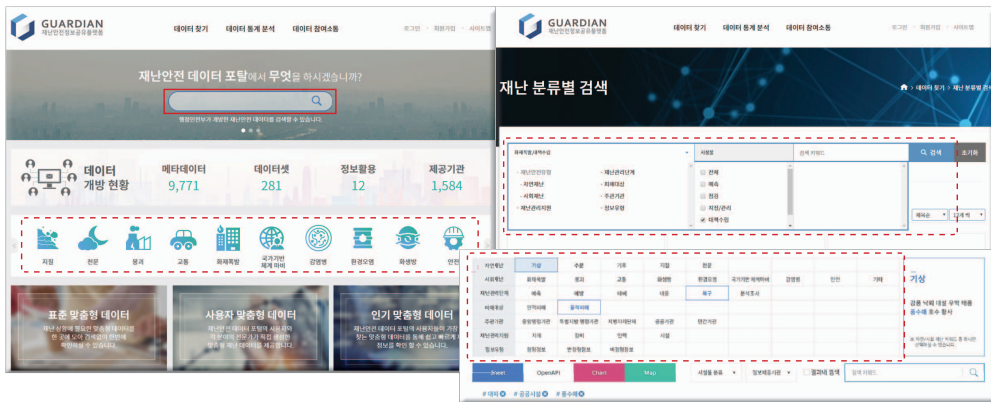
[그림 3] 재난안전정보공공플랫폼 적용 예시

로 적용되어 패시 내비게이션의 역할을 통해 검색을 지원하고 있다. 또한 본 표준의 분류 항목들은 전문 용어보다 일반 용어를 우선 적용하였기 때문에 향후 재난 안전 실무자뿐만 아니라 대국민 서비스를 위해 활용할 수 있을 것이다.