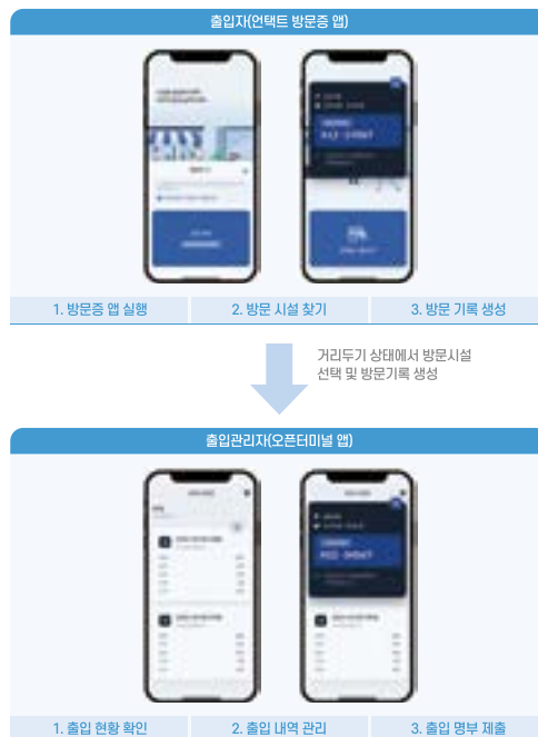
(주)이스툼 언택트 방문증 개념도

(주)이스툼이 개발한 비컨 기반 동적 인증정보를 이용한 기록 절차와 관련한 기술은 근접 거리 및 근거리에서 개인정보의 교환 없이도 이용자가 해당 장소에 있었다는 것을 증명할 수 있는 기술이다. 코로나19로 인해 출입기록에 대한 의무화가 시행되고, 전자출입명부의 사용이 확대되면서 (주)이스툼은 해당 기술을 활용한 언택트 기반 전자출입명부 시스템을 출시하였으며, 이를 통해 사회적 기여를 이루고자 하는 바람으로 TTA ICT 표준기술 자문 서비스를 신청하여 표준화에 도전하였다. TTA의 표준화 자문을 통하여 적절한 표준화 활동 접근 방법과 완성도 높은 표준 문서 작성이 가능하였으며, 시대적 상황과 맞물려 표준화 위원들의 많은 공감을 통해 신속하게 TTA 단체 표준에 제정되었다.