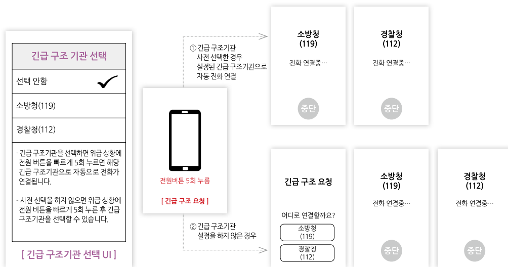
[그림 2] 긴급 구조기관 선택 화면 예시