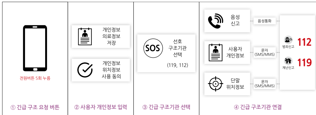
[그림 1] 긴급 구조 요청 스마트폰 인터페이스 표준의 개념적 구성도